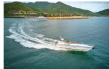
Tàu cao tốc