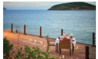
Địa điểm ăn tối ấn tượng