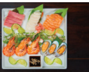
Hải sản địa phương