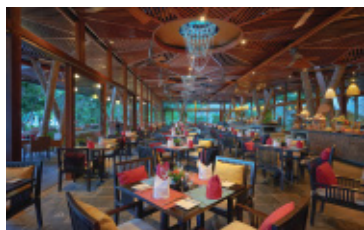
Nhà hàng Bacaro

Hãy cùng khám phá và trải nghiệm thực đơn đa dạng của chúng tôi tại những địa điểm ăn uống ấn tượng, dù dùng bữa ở nhà hàng Bacaro hay trên một cầu cảng riêng tư bên cạnh mặt nước lung linh gợn gió của vùng vịnh. Để thưởng thức các món ăn kinh điển quốc tế và các món đặc trưng mang đậm hương vị truyền thống từ 3 miền Việt Nam, kết hợp với dịch vụ mộc mạc mà chu đáo từ đội ngũ nhân viên thân thiện, hãy đến với chúng tôi và trải nghiệm những điều tinh túy nhất của Việt Nam và Thế giới.