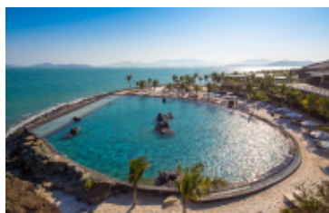
Hồ bơi nước biển

Thỏa sức thư giãn tại một trong ba hồ bơi lớn tại resort - hồ bơi nước biển (2,500m 2 ) và hai hồ bơi nước ngọt (700m 2 và 600m 2 ) hoặc tại vịnh biển tự nhiên với bãi cát trắng mịn.