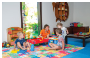
CLB trẻ em Chú Rùa Nhỏ