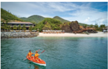
Chèo thuyền kayak

Khu nghỉ dưỡng Amiana giới thiệu nhiều hoạt động thú vị trong kỳ nghỉ của bạn với các chương trình tập yoga, bóng chuyền bãi biển, đi thuyền kayak, tập lặn, câu lông, v.v theo một lịch trình định kỳ và miễn phí.